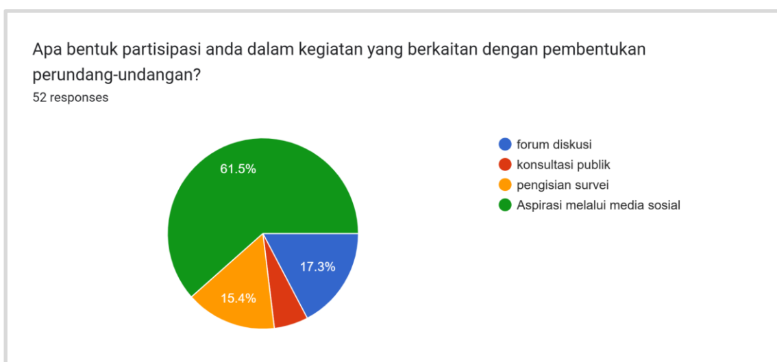
Diagram 3. Disajikan Data Mengenai Bentuk Keterlibatan Masyarakat Pada Pembentukan Aturan Perundang-Undangan

Oleh karena itu akan disajikan hasil dari analisis bentuk keterlibatan masyarakat pada pembuatan ketentuan perundang-undangan, yang diambil dari para responden masyarakat yang berjumlah 52 orang.